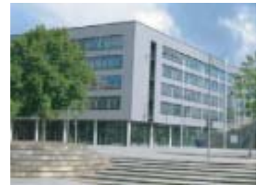
Unsere Büros in Hannover

Der Sitz der Zarafa-Tochtergesellschaft für den deutschsprachigen Raum ist in der für die CeBIT bekannten Messestadt Hannover. Dort und in vielen weiteren Teilen Deutschlands werden Informationsveranstaltungen und Seminare angeboten, die den Vorteil von Outlook Exchange Alternativen vorstellen und Fachwissen rund um Groupware vermitteln. Die Zarafa Deutschland GmbH stellt ebenfalls sicher, dass die speziellen Anforderungen des deutschsprachigen Marktes in die Produktentwicklung einfließen und forciert den direkten Kontakt zur Region.